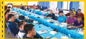
การประชุมเพื่อหารือมาตรการป้องกัน แก้ไข และลดผลกระทบสิ่งแวดล้อม (กลุ่มย่อย ครั้งที่ 2) ดำเนินการเมื่อวันที่ 20 พฤษภาคม 2568 จำนวน 2 กลุ่ม ณ สำนักงานเทศบาลตำบลศรีสะเกษ และห้องประชุมที่ว่าการอำเภอเวียงสา จังหวัดน่าน โดยมีผู้เข้าร่วมประชุมจำนวนทั้งสิ้น 98 คน