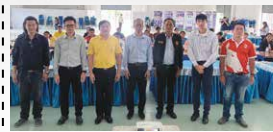
การประชุมเสนอแนวคิดในการกำหนดรูปแบบทางเลือก การพัฒนาโครงการเบื้องต้น (กลุ่มย่อย ครั้งที่ 1) ดำเนินการเมื่อวันที่ 17 ตุลาคม พ.ศ. 2567 จำนวน 2 กลุ่ม ณ สำนักงานเทศบาลตำบลศรีสะเกษ และห้องประชุมที่ว่าการอำเภอเวียงสา จังหวัดน่าน ผู้เข้าร่วมประชุมทั้งสิ้น 124 คน