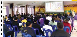
การประชุมสรุปผลการคัดเลือกรูปแบบการพัฒนาโครงการ (สัมมนา ครั้งที่ 2) ดำเนินการเมื่อวันศุกร์ที่ 17 มกราคม พ.ศ. 2568 ณ ห้องประชุมสำนักงานเทศบาลตำบลศรีสะเกษ อำเภอหนองยี่ จังหวัดน่าน และการประชุมออนไลน์ ผ่านระบบโปรแกรม Zoom Cloud Meetings มีผู้เข้าร่วมประชุมทั้งสิ้น 98 คน