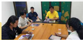
การเข้าพบหน่วยงานราชการที่เกี่ยวข้องในพื้นที่ ดำเนินการระหว่างวันที่ 17 - 18 กรกฎาคม พ.ศ. 2567