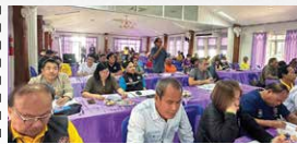
การประชุมปฐมนิเทศโครงการ (สัมมนา ครั้งที่ 1) ดำเนินการเมื่อวันที่ 16 สิงหาคม พ.ศ. 2567 ณ ห้องประชุมสำนักงานเทศบาลตำบลศรีสะเกษ อำเภอหนองยี่ จังหวัดน่าน และการประชุมออนไลน์ ผ่านระบบโปรแกรม Zoom Cloud Meetings มีผู้เข้าร่วมประชุมทั้งสิ้น 143 คน